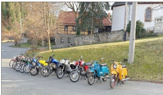
Stellprobe Simson & Co.

Wir erwarten schönsten Pfingstwetter, bestgelaunte Gäste und eine unvergessliche Feier.