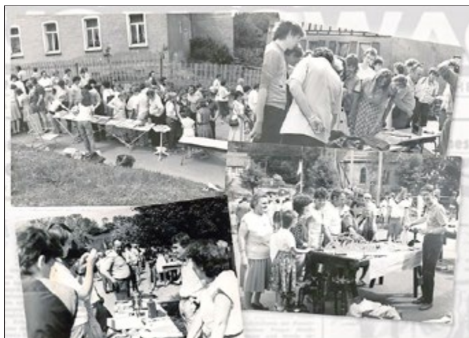
Trödelmarkt anno dazumal

Montag ist Feiertag...für die Solkwitzer dann ein Ruhetag.