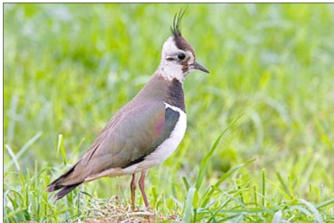
Kiebitz mit aufgestellter Federhülle.

Der Wiesenbrüter ist zum Vogel des Jahres 2024 gewählt worden - und er kann die Aufmerksamkeit gut gebrauchen. Da feuchte Acker- und Grünlandflächen im gesamten Land immer seltener zu finden sind, ist der Kiebitz inzwischen vom Aussterben bedroht. Feuchtwiesen wurden trockengelegt und zu Ackerland umgewandelt. So verschwand der Lebensraum der Tiere langsam. Ein weiteres Problem sind die Pestizide, die auf die Felder aufgebracht werden. Der Rückgang der Art ist dramatisch und liegt deutschlandweit bei mehr als 80 %.