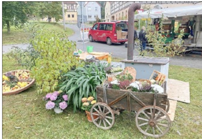
Detscher frisch vom Holzofen

20 Uhr Tanz im Festzelt mit der Band Ragged Glee . - Die sechs Musiker aus Thüringen legen Vollgas los mit Brandaktuellen Chartbreakern, Musik der 80er und 90er und natürlich angesagten Partykrachern...da ist für jedes Tanzbein was dabei.