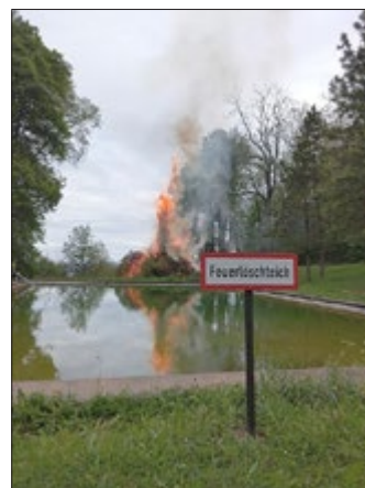
Maifeuer in Solkwitz

Ostern haben wir noch ruhig hinter uns gelassen. Ein paar Eier im Dorf aufgehängt und die Ruhe genossen. Doch der Terminplan für die nächsten Wochen ist geschrieben. Dabei sollte der Spaß natürlich nicht zu kurz kommen. Neben allerlei Arbeiten im Dorf, wie die obligatorische Dorfreinigung im Frühjahr, wird auch das Maibaum setzen mit anschließender Zusammenkunft am Maifeuer geplant.