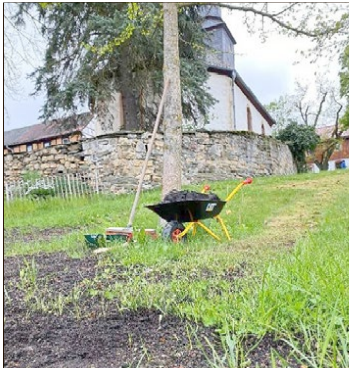
Arbeitseinsatz im April

950 Jahre Ersterwähnung - Pfingsten in Solkwitz