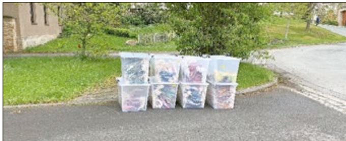
Wimpel sind vorbereitet

Die Einladungen für unsere Eröffnungsveranstaltung am Freitag (17.05.) sind verschickt und wir erwarten unsere Gäste.