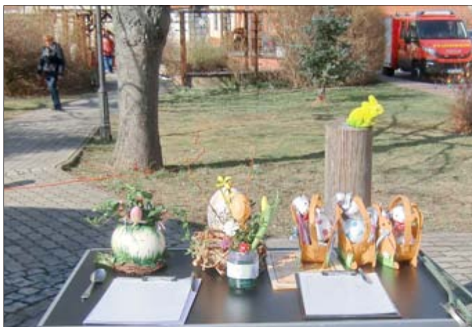
Die hochwertigen Preise für die Sieger des Straußen-Eierlaufes waren hart umkämpft.