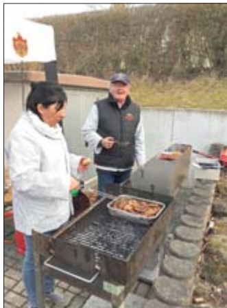
Angeboten wurden Kaffee und selbstgebackener Kuchen, allerlei Getränke und Deftiges zum Abendbrot.