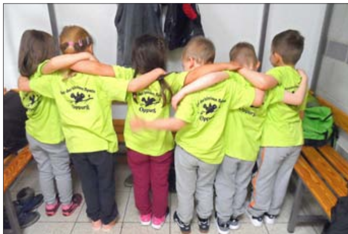
Gemeinsam sind wir stark und mit unseren neuen T-Shirts umso mehr.

Im Anschluss mussten die Mannschaften 5 verschiedene Wertungsstationen in Staffelform absolvieren. Nach einer Frühstückspause, in der wir uns stärkten, konnten sich alle Teilnehmer an 10 unterschiedlichen Spiel- und Spaßstationen sportlich betätigen. Gespannt warteten wir auf die Siegerehrung und nahmen voller Stolz die Medaillen sowie den Pokal für den 2. Platz entgegen.