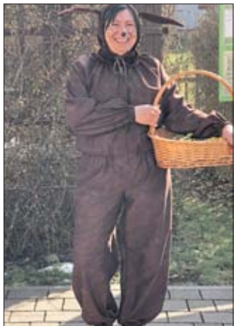
Der Osterhase verteilte Süßes an die Kinder.