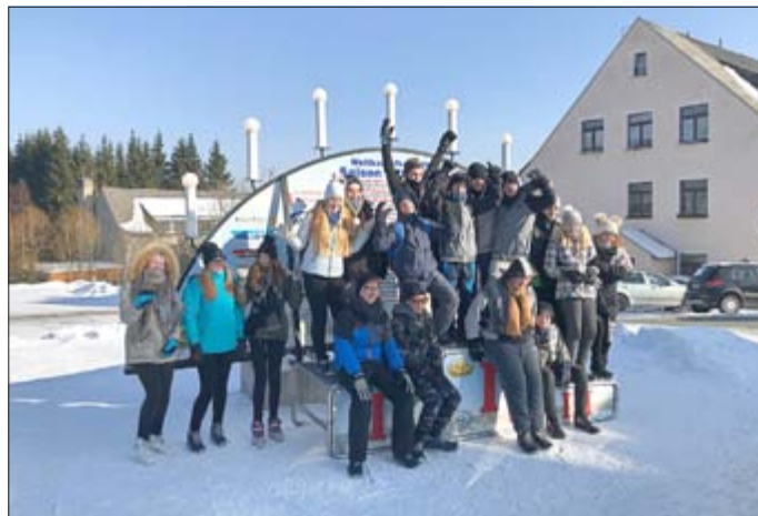
Klasse 7 b der Regelschule Oppurg