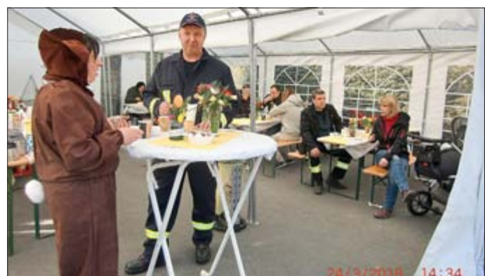
Die Besucher erwartete ein mit Liebe geschmücktes Festzelt.