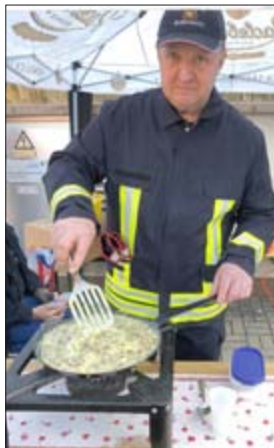
Straußeneier wurden zu Rührei.