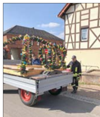
Die Feuerwehr Bodelwitz und ihr Förderverein haben am 25. März feierlich den Dorfbrunnen in einen Osterbrunnen verwandelt.