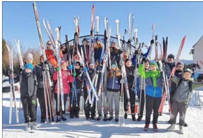
Klasse 7 a der Regelschule Oppurg

Die Kammloipe bei Johannegeorgenstadt bot dafür die besten Voraussetzungen und mit der Skibaude des WSV hatten Schüler und Lehrer an diesem Tag eine herrliche Kulisse für die Mittagspause, zu der die Mitarbeiter der Herberge leckere Kartoffelsuppe mit Wienern servierten.